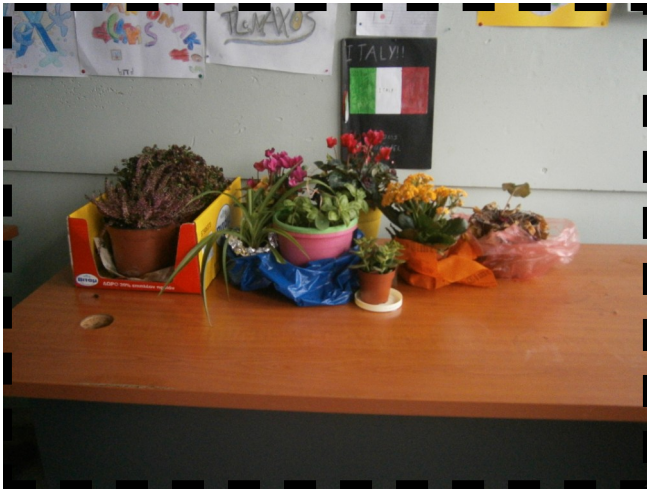
Η γωνιά των λουλουδιών