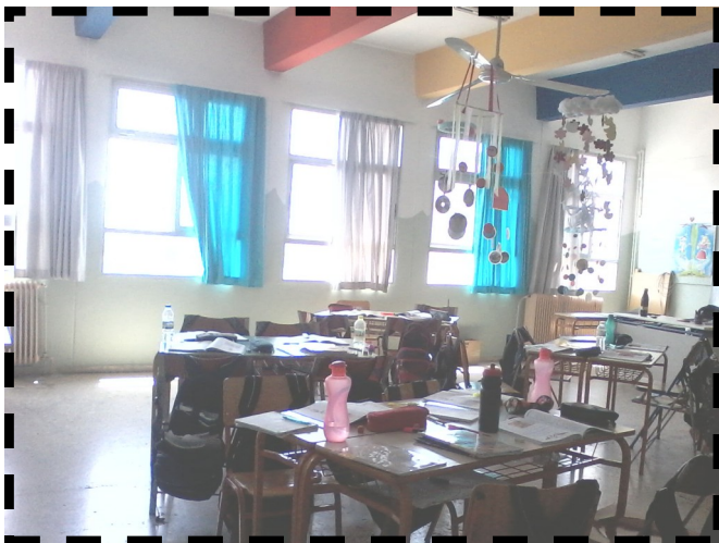
Η τάξη μας πέρυσι