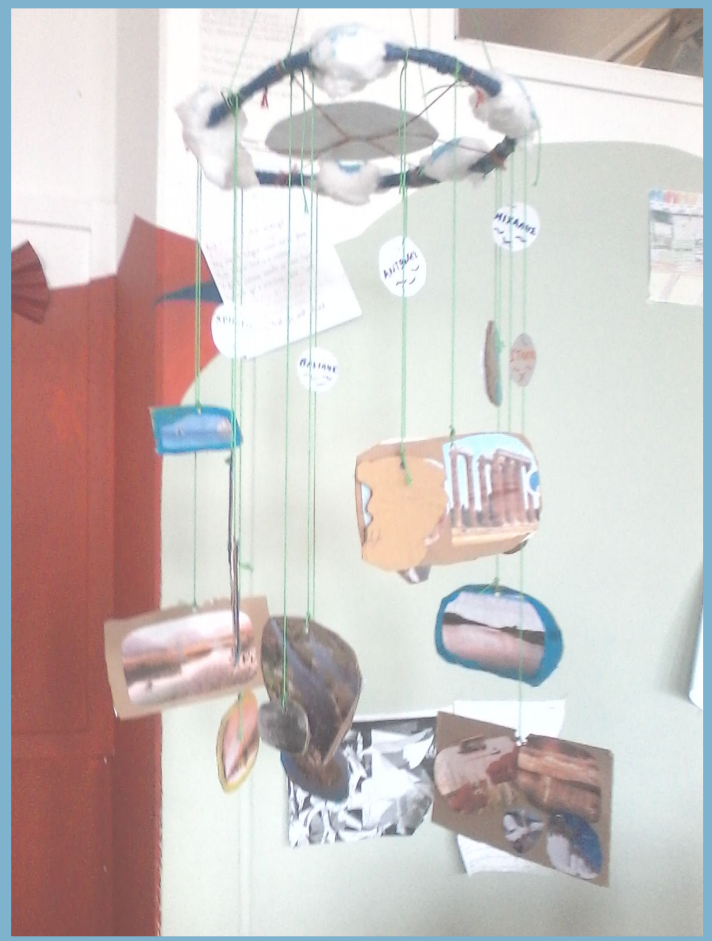
Μόμπιλο των συμμαθητών μας