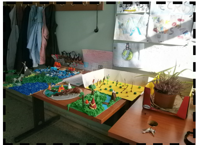
Κατασκευές και ζωγραφιές που έχουν κάνει τα παιδιά της τάξης.